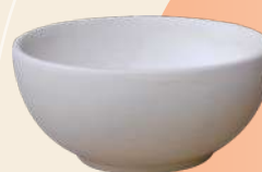
Bowl Gohan n° 2