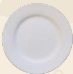
Mery 18 x 2 cm