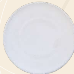
Romance n° 2 13.5 X 2 cm