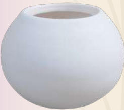
Mila 8 x 12 cm