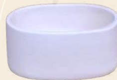
Cosito n° 1 3 x 7.5 cm