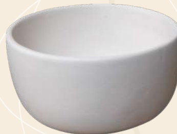
Paty n° 2 9 x 5 cm