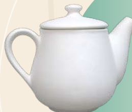
Romance 16 x 21 cm