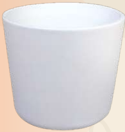
Laura 8 x 10 cm