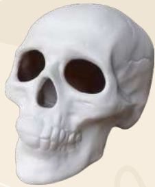
Cráneo 13 x 19.5 cm