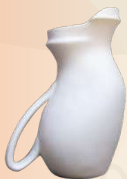
Alicia 21 x 12 cm