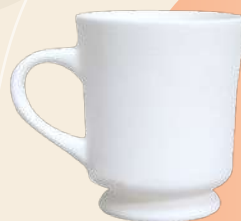
Mery 9.5 X 8 cm