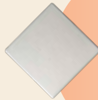
Mosaico 10 cm 10 x 10 cm