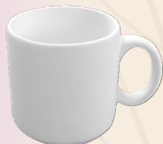
Alicia 10 x 9 cm