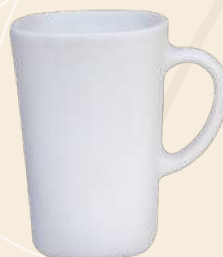
Malteada 11 x 7 cm