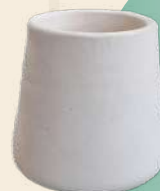
Mate n° 1 6 x 5 cm