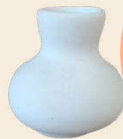
Bule 6 x 5 cm