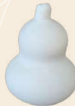
Bule n° 2 23 x 14 cm