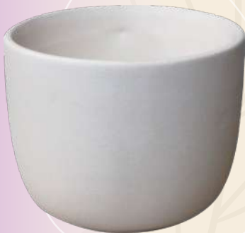
Paty 9 x 9 cm