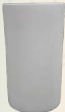
Vaso Cristal n° 2