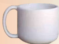
Claudia 7.5 X 8.5 cm