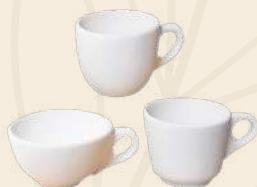
Mini Espresso n° 1, 2 y 3 5 x 6 cm