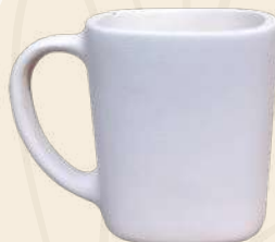
Malteada n° 2 7.5 X 7 cm