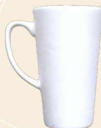
Anne 14 x 8.5 cm