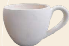
Danna jumbo 14 x 12 cm