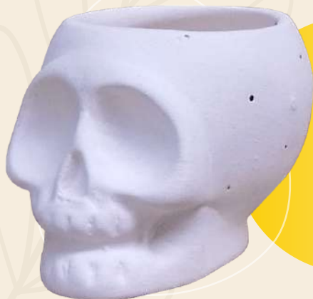
Pancha 5 x 6 cm