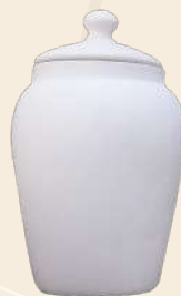
Tiborcito N° 2 c/ tapa 16 x 14 cm