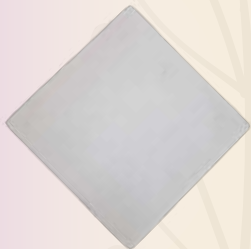
Mosaico 16 cm 16 x 16 cm