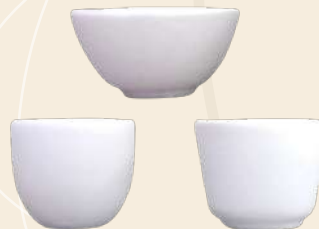
N° 1, n° 2 y n° 3 5 x 5 cm