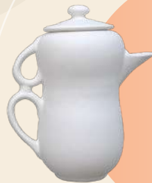
Lulú 17 x 15 cm