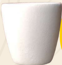
Vasito Shot 6.5 X 5 cm