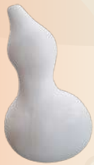
Bule n° 1 26 x 22 cm