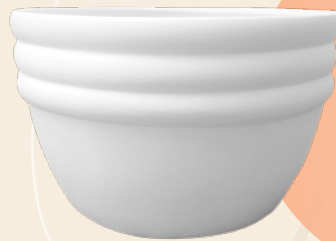
Amira 11 x 17 cm