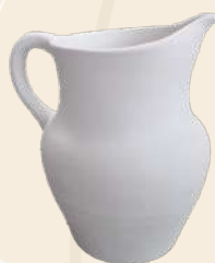
Difty 26 x 22 cm