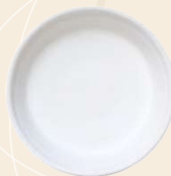
Karen n° 1 12 x 3 cm