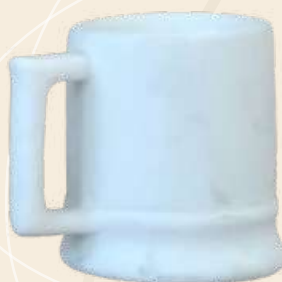
Tarrito Estrella 6.5 x 5.5 cm