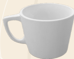
Laura 12 x 8 cm