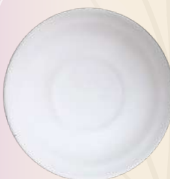
Pastelero 13 x 2 cm