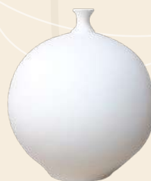
Tibor esfera 30 x 30 cm