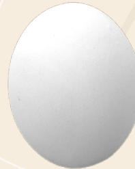
Huevo de Pascua n° 3 Diámetro 5 cm