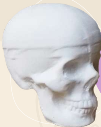
Lilia 6 x 5 cm