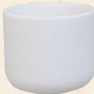
Claudia 7.5 X 8.5 cm