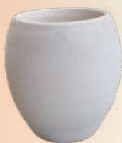
Mate n° 2