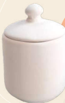
Alicia 10 x 11 cm