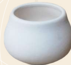
Mini Lulú 3 x 4 cm