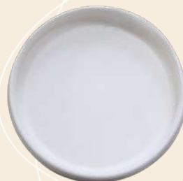
Icela n° 1 15 x 2 cm