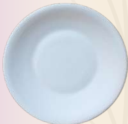
Chiquitín 10 x 4 cm