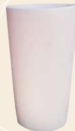
Vaso Anne n° 1