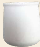
Potecito n° 1 6.5 X 5 cm