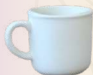
Mini posillo 5 x 5 cm