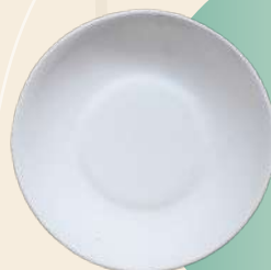
Viki 17 x 3.5 cm