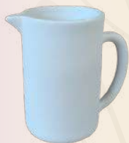
Dodita 14 x 9 cm