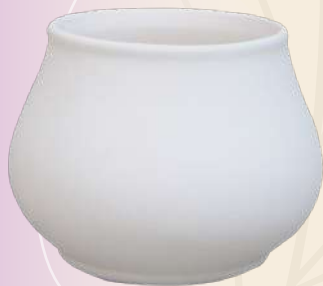
Bolita 11 x 13 cm