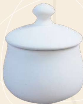
Lulú 11 x 9 cm