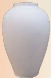
Tibor n° 1 48 x 24 cm