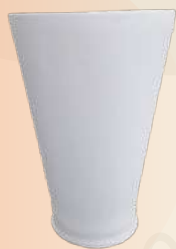
Copa 40 x 22 cm