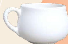
Lulú 9 x 7.5 cm