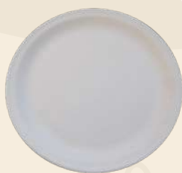
Ancho 28 x 22 cm