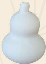
Licorera Bule 23 x 14 cm