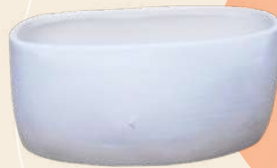
Ovalada 12 x 20 cm