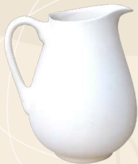
Lechera Ana 18 x 10 cm