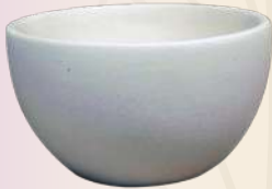
Denny 5.5 X 10 cm