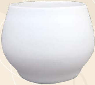
Abi 9 x 10 cm