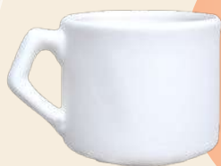
Sofy 8 x 9 cm