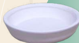
Lulú 9.5 X 2 cm