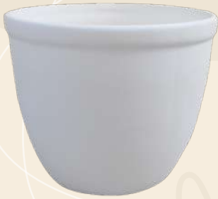
Natalia 10 x 13 cm