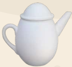
Huevo 15 x 12 cm