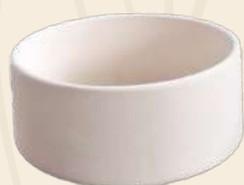
Plato p/Mascota 6 x 13 cm