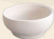
Postre Aurora 5 x 7 cm