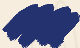
Azul Cobalto Áreas