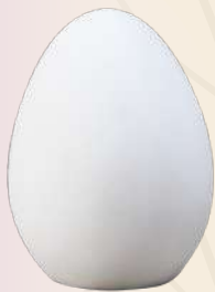
Huevo de Pascua n° 2 15 x 10 cm