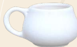
Mini lulú 4 x 5 cm