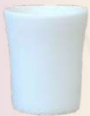
Lulú 6 x 5 cm