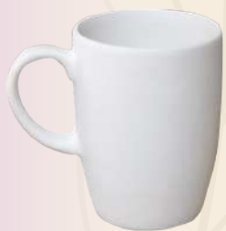
Tania 9 x 6 cm