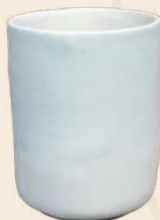
Vaso Lulú 10 x 8 cm