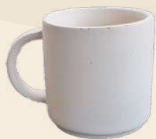
Lore 7 x 6 cm