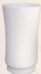
Ideal 25 x 16 cm