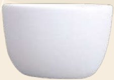
Bala 5 x 5 cm