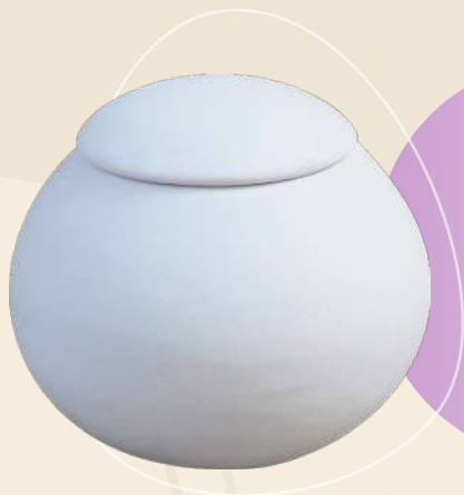
Mila 9 x 12 cm