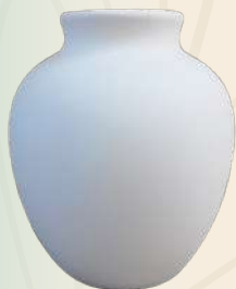
Tiborcito 16 x 14 cm