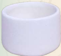
Cosito n° 2 3 x 5 cm