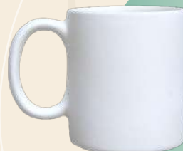
Mariana 10 x 9 cm