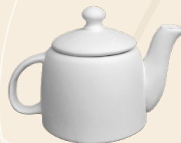
Paty 15 x 19 cm