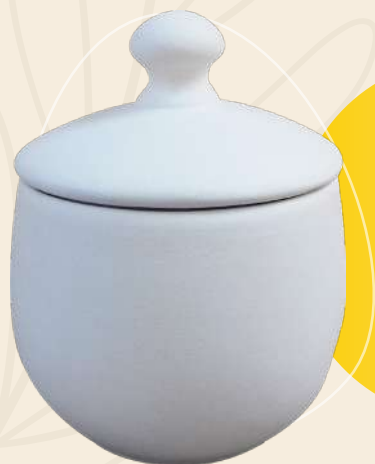
Romance 9 x 9 cm