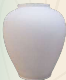
Tibor chino 22 x 25 cm