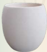
Karla 18 x 19 cm