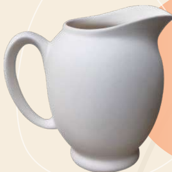
Phannie 15 x 17 cm