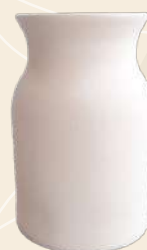
Perol 22 x 25 cm