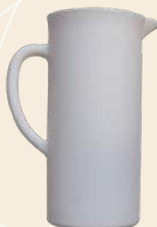
Doda 23 x 18 cm