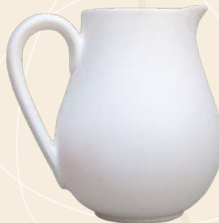
Romance n° 2 18 x 16 cm