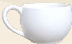
Romance 6.5 X 9 cm