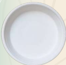
Karen n° 2 (Cenicero) 9 x 3 cm