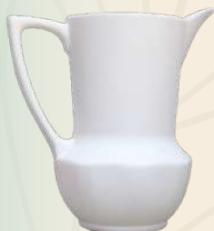
Iris 20 x 18 cm