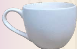
Danna 14 x 8 cm