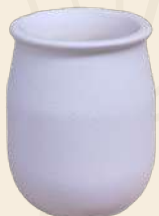
Potecito n° 2 6.5 X 5 cm