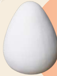
Huevo de Pascua n° 1 22 x 20 cm