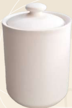
Ana 10 x 11 cm