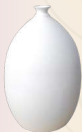
Tibor huevo 30 x 20 cm