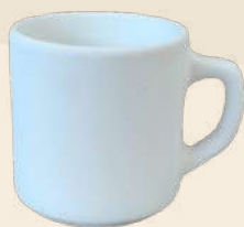
Meli 8 x 8.5 cm