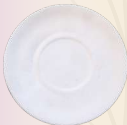
Romance 15 x 2 cm