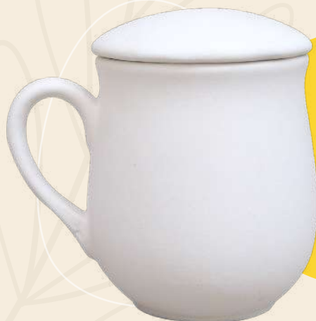
Romance c/tapa 11 x 8.5 cm