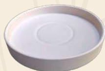
Susy 4 x 25 cm