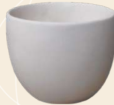
Danna 8 x 9.5 cm