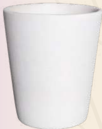
Vaso Anne n° 2