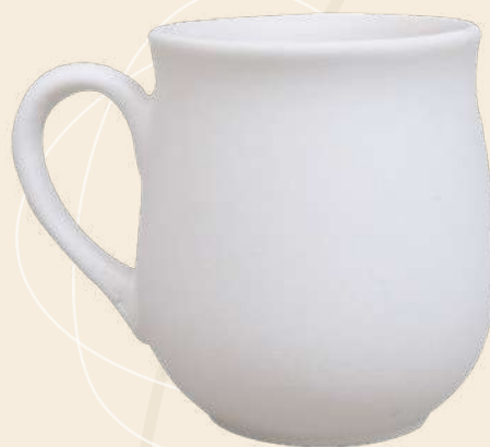
Romance 10.5 X 8.5 cm