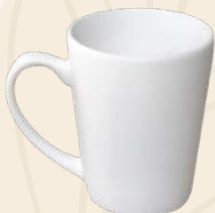
Anne n° 2 9 x 6 cm