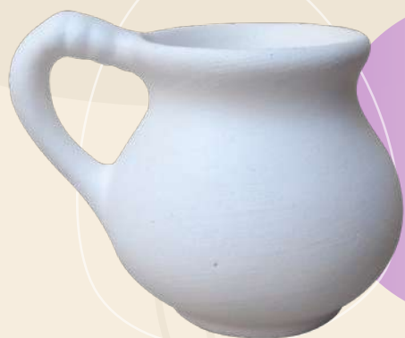
Lore 6 x 6 cm