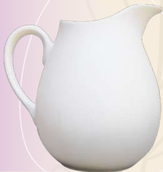
Romance n° 1 22 x 28 cm