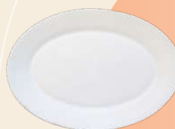
Ovalado 28 x 2 cm