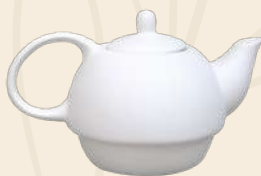
Renata 10 x 18 cm