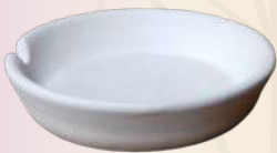
Cenicero Lulú 2 x 9.5 cm