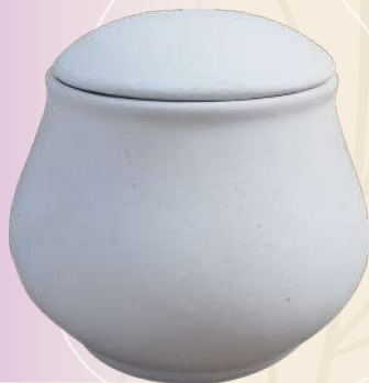
Bolita 12 x 9 cm