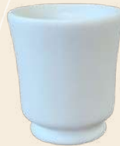
Mery 8 x 8 cm