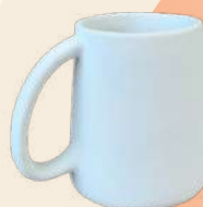
Amaya 10 x 8 cm