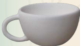
Denny 13 x 5.5 cm