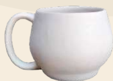
Abi 9 x 10 cm