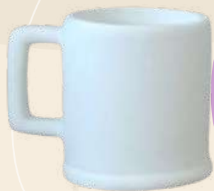
Tarrito Elisa 6 x 5 cm