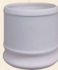
Estrella 14 x 12 cm