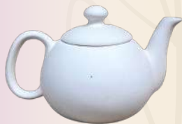
Marité 10 x 18 cm