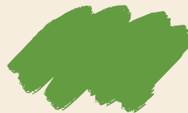
Verde Limón N° 2