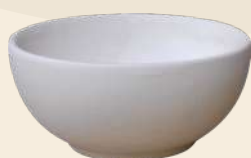
Bowl Gohan n° 1