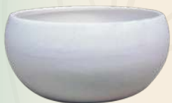
Mila n° 2 8 x 12 cm